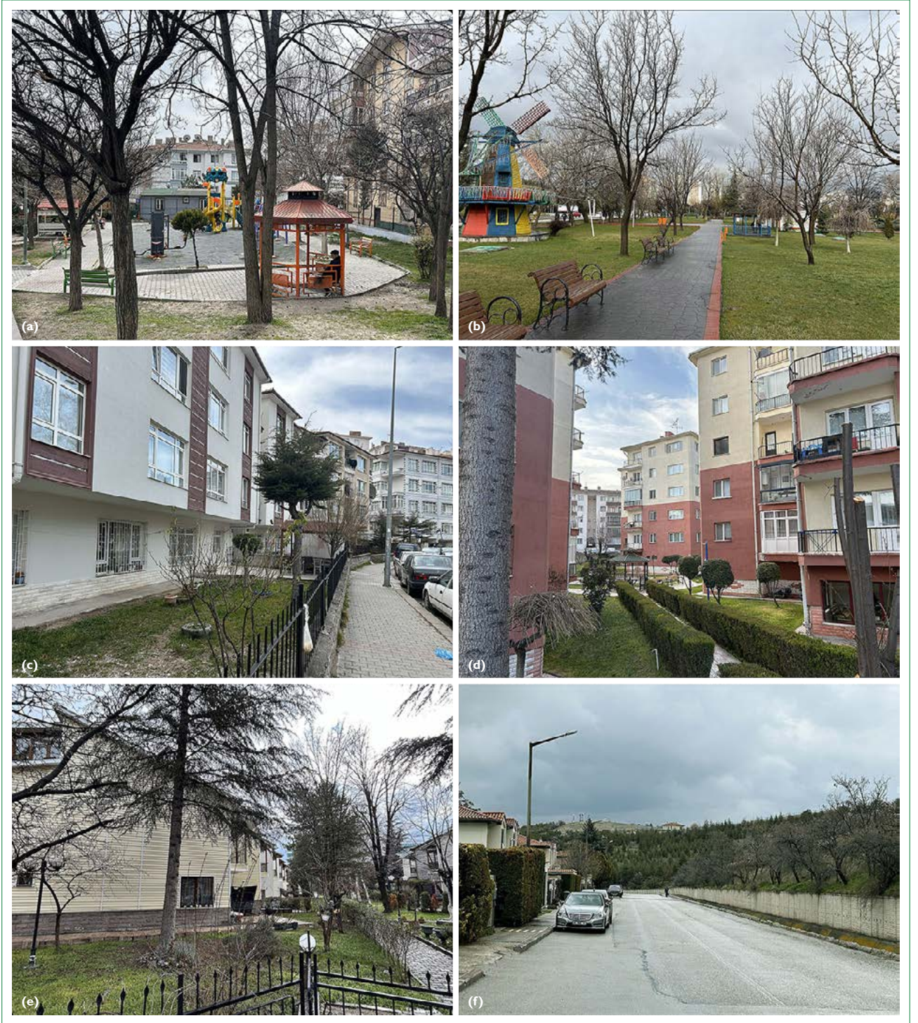
Şekil 2. Seçilen mahallelerdeki açık yeşil alanlardan fotoğraflar.

yüzden seçim sürecinde mahallelerin konumları, yeşil alanlarına ilişkin proje yürütücüsünün ve araştırmacıların gözlemleri ve mahallelerin nüfus yoğunluğu gibi veri toplama süreçlerinin başarısını etkileyebilecek çeşitli faktörler belirleyici olmuştur. Bu doğrultuda, seçilen mahallelerden bir kısmı, kent içinden seçilen Peyami Safa Mahallesi'nde olduğu gibi, görece küçük